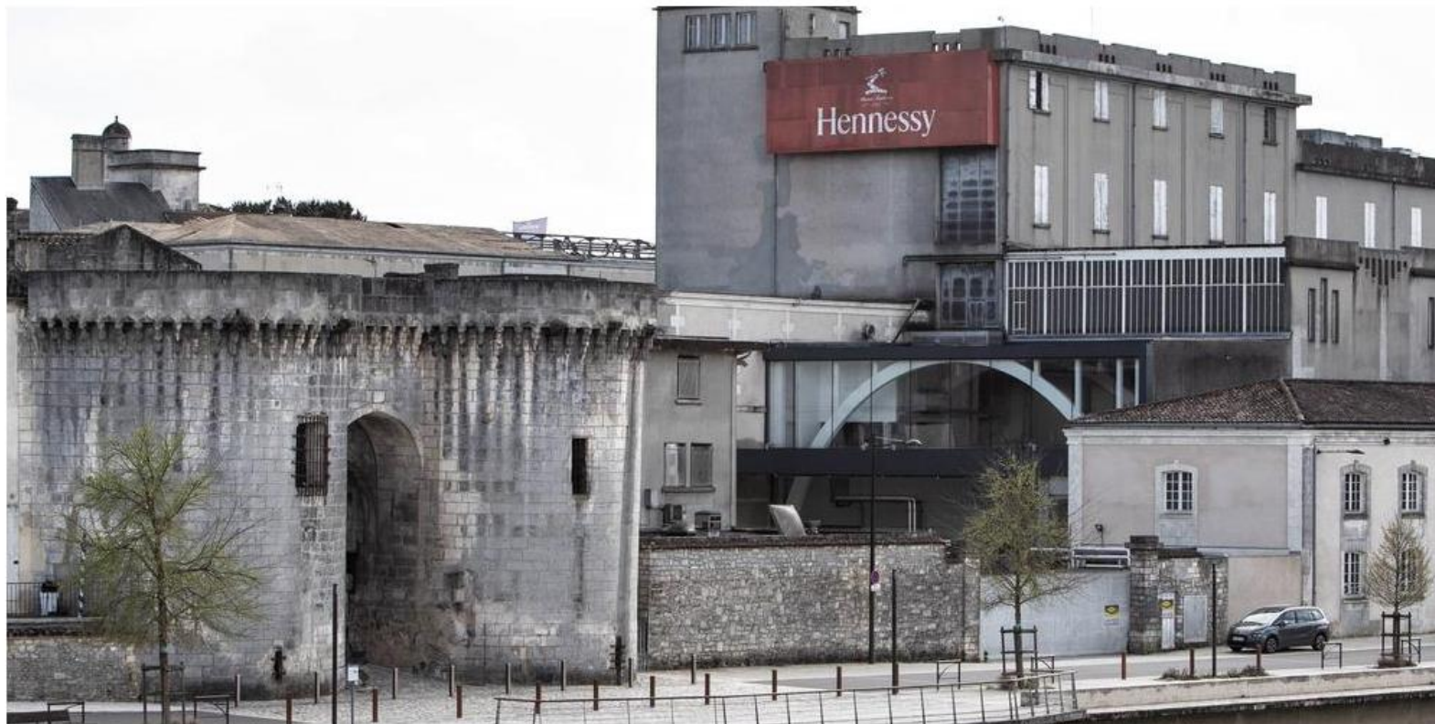
La démolition de quatre bâtiments près de la porte Saint-Jacques va faciliter l'accès au monument historique.