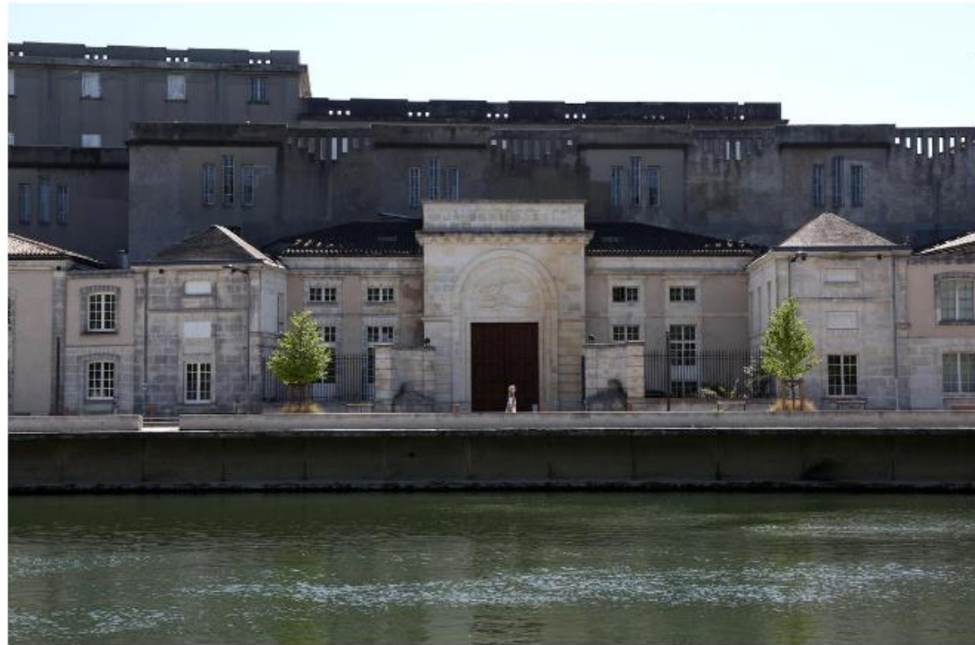
📍 L'entrée monumentale, quai Maurice-Hennessy, va reprendre du service. C'est ici que se croiseront les salariés, les fournisseurs et les visiteurs. La halle Oudin, à l'arrière, doit devenir une « vaste agora ».